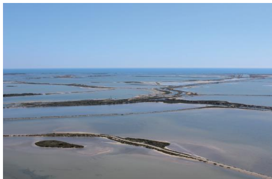
Vue aérienne des salins d'Aigues-Mortes

La Camargue Gardoise offre un visage résultant de phénomènes naturels autant que des actions humaines. Territoire de rencontre entre les eaux tourmentées du Rhône et celles tumultueuses de la Méditerranée, il a nécessité l'habileté des Hommes pour l'occuper et développer une économie locale liée à la gestion des eaux douces salées : pêche, riziculture, saliculture, élevage, etc. Dans cette immensité plane, le