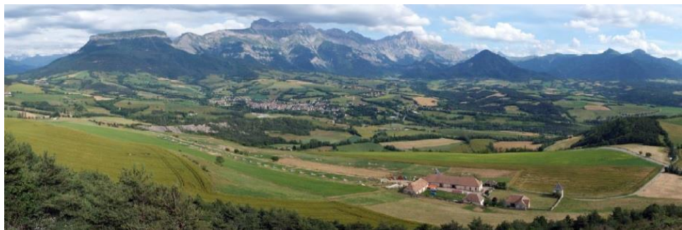
© Plan de Paysage du Trièves B. Rétif (Itinéraire Bis) A. Daburon (JAM)

Lauréat 2013 de l'appel à projet Plans de Paysage * organisé par le ministère de la transition écologique et solidaire, le Trièves entend se doter par ce biais d'une vision partagée, pour appréhender ces problématiques sous l'angle de la cohérence globale d'un projet à même de fédérer les forces vives du territoire