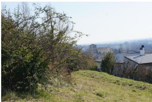
Des vues et sentes à redécouvrir

Pourtant de nombreux points d'appuis à différentes échelles permettent de mettre en relief des sites uniques mais également la mémoire des lieux, notamment au