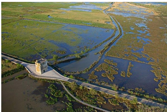
La Tour Carbonnière

Ce double enjeu constitue l'axe central d'un travail complexe engagé depuis 2003 dans le cadre de l'Opération Grand Site. Après plusieurs années de travaux d'aménagement, de reconquête paysagère, d'organisation de la découverte, de gestion concertée des milieux, de sensibilisation ; le territoire a obtenu le label « Grand Site de France » en 2014. Il est aujourd'hui à l'aube d'une candidature au renouvellement de son label, qui l'engagera à définir une nouvelle vision de territoire à court, moyen et long terme.