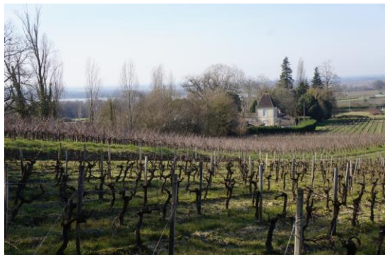
Propriété viticole

A mi-chemin entre deux biens UNESCO (St Emilion et La citadelle de Blaye), les paysages de la commune sont en pleine mutation du fait d'une forte croissance démographique et urbaine.