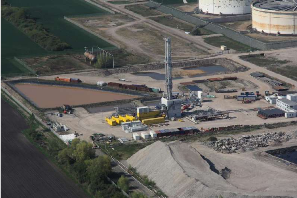
Figure 4: Rig B04 de 450 tonnes (site de vendenheim).

Les cibles géothermiques étant à des profondeurs importantes, des procédures de HSE de type exploitation pétrolières sont mises en place avec la formation adaptée du personnel et un spécialiste HSE. Elles couvrent notamment :