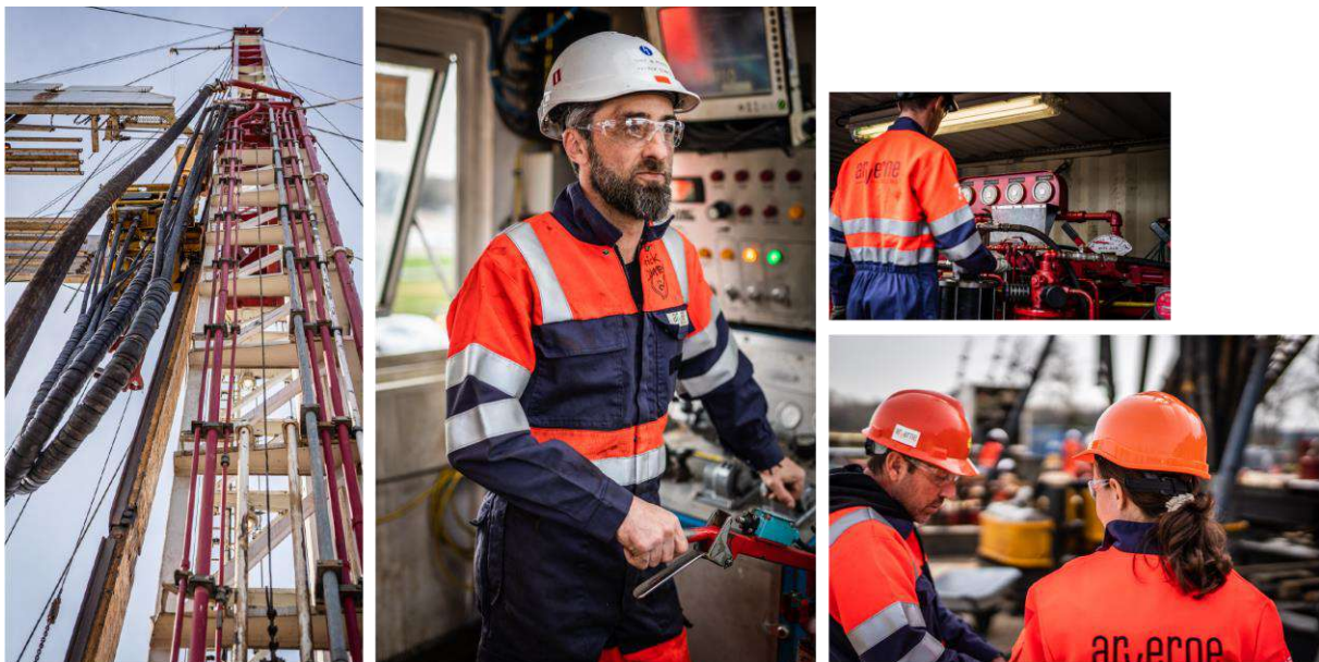
Figure 3: Aperçu des activités de Drillstore

Titulaire d'un contrat cadre pluriannuel avec l'entreprise française STORENGY avec le rig MR8000 pour l'entretien de puits de stockage de gaz, DRILLSTORE met à disposition de chaque projet un personnel qualifié, expérimenté, formé, disposant des habilitations et certifications requises pour réaliser le programme de travail qui lui est confié. Les équipes sont constituées en prenant en compte les capacités de synergie et de coopération propres à des personnes travaillant ensemble depuis de nombreuses années.