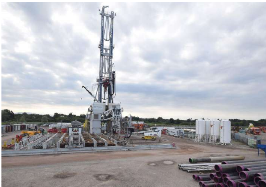
Figure 5: Photo du nouveau RIG B04 450T appartenant à Georhin pour le 2 nd forage sur le secteur de Vendenheim.

Fort de son succès sur le premier puits de Vendenheim, Georhin initie son second puits fin août 2018 avec cette fois son propre RIG B04 450T et des équipes renforcées pour assurer les opérations de forage et le suivi des paramètres instantanés via l'achat d'une cabine de Mudlogging.